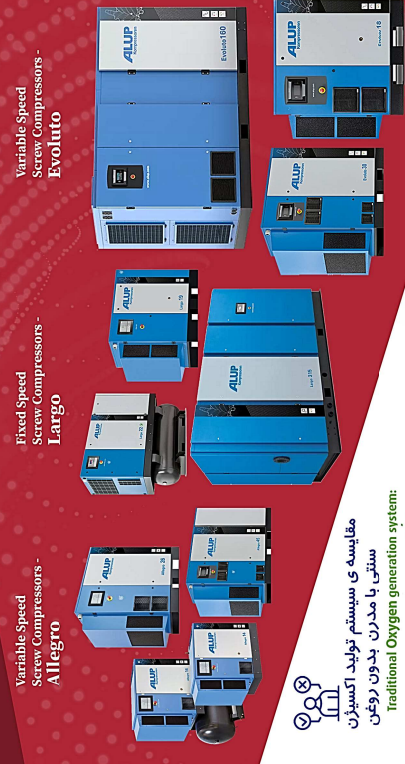
Variable Speed Screw Compressors - Allegro